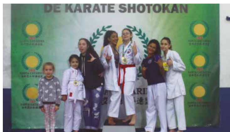
>> Meninas comemoram as vitórias de Palhoça.