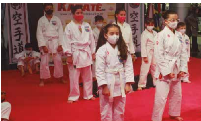
>> Faixas-Brancas: Futuro do Karatê.