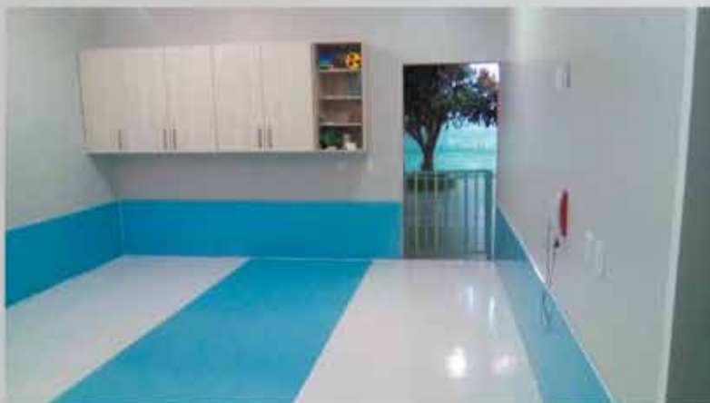
Piso Fofinho para berçario