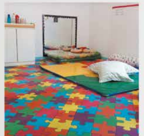
Piso em manta Infantil