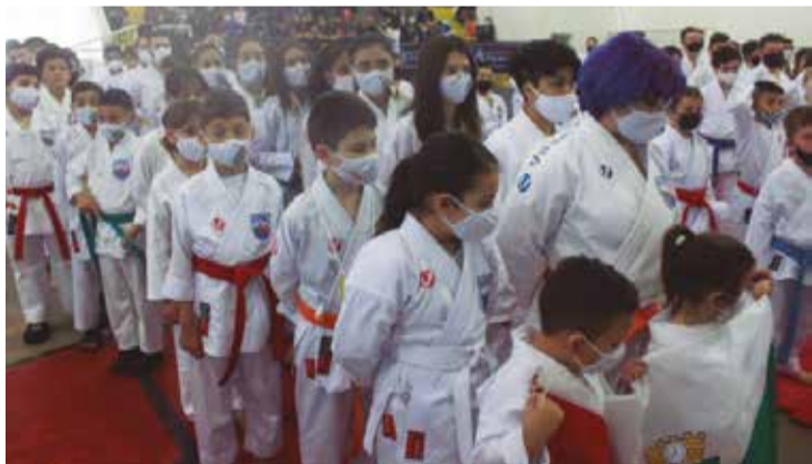
>> Orgulho de ser Palhocense.