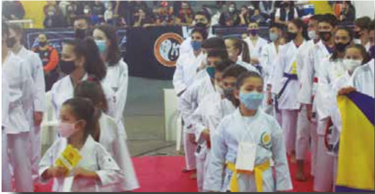
>> Um dos momentos mais marcantes foi a abertura do evento.