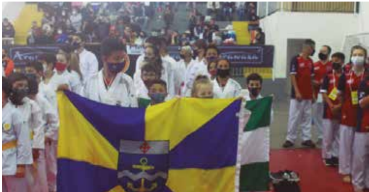
>> A participação de vários municípios, consolida o trabalho que a Associação Palhoça de Karatê vem realizando no cenário esportivo dentro do Karatê do Estado.