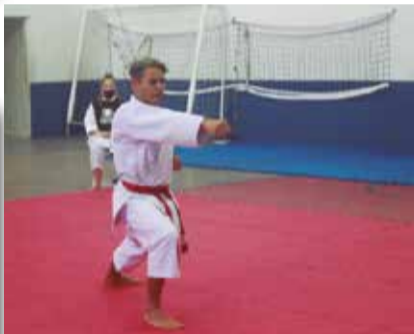
>> As categorias tiveram páreos bem duros para a arbitragem.