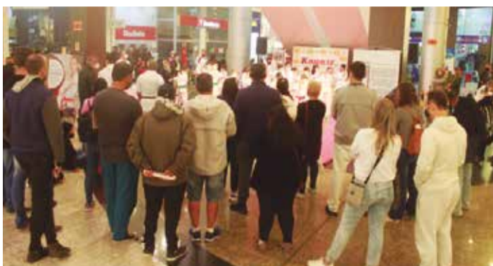
>> As dependências do Shopping ViaCatarina ficaram lotadas com a presença dos familiares e pessoas que puderam conhecer nossa arte.