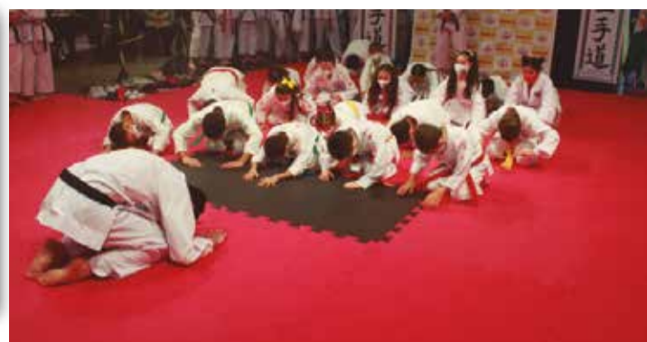
>> Todos os inícios de aula e término são feitos com a saudação protocolar, que faz com que o karateca lembre que nós temos o respeito acima de tudo.