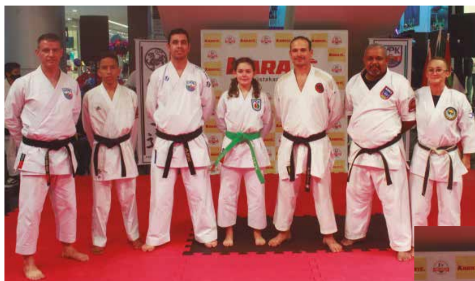
>> A presença de renomados professores movimentaram o evento e os alunos.

A parceria com o Shopping ViaCatarina é uma das mais valiosas realizadas pela APK, isso porque sendo o Shopping da cidade também é o local de encontro das famílias palhocenses. Por lá passam milhares de pessoas durante o dia e a possibilidade de estarmos realizando ações num espaço tão significativo de nossa sociedade como é o ViaCatarina abre portas importantes para a instituição que precisa estar sempre em evidência nas suas ações.