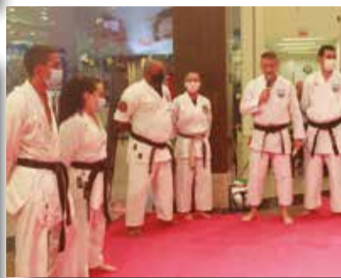
>> Um dia cercado de emoções.