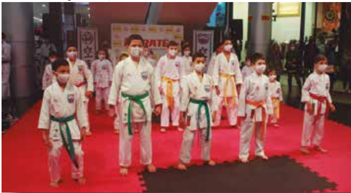
>> São muitas imagens que ficarão na memória.