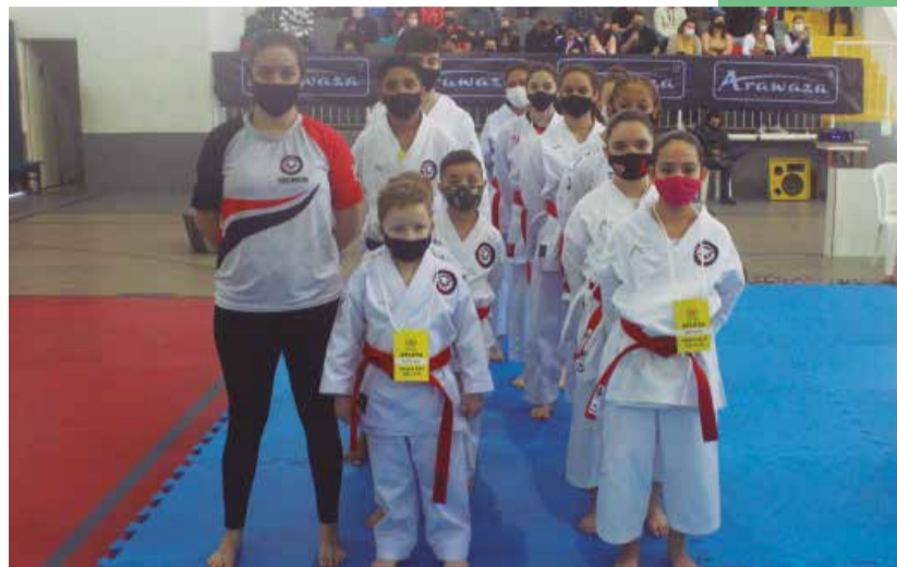
A presença de atletas de várias cidades do estado em Palhoça, marcou a volta das competições presenciais em Santa Catarina.