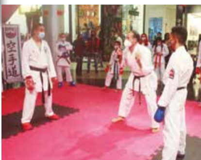
>> Durante o dia foram muitos os ensinamentos.