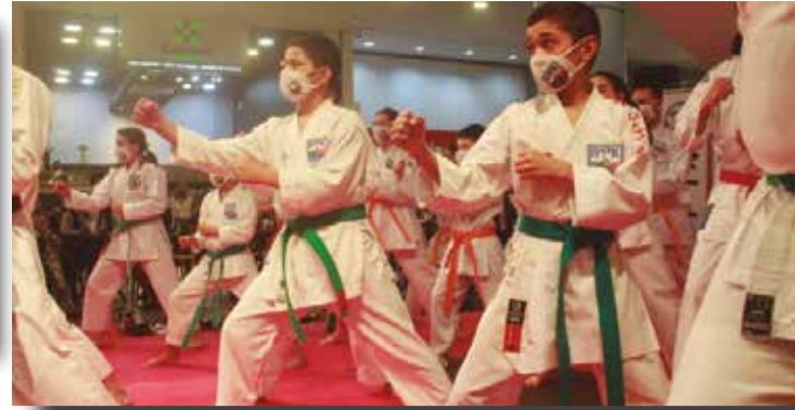
>> Concentração é uma das marcas que o Karatê deixa em quem pratica.