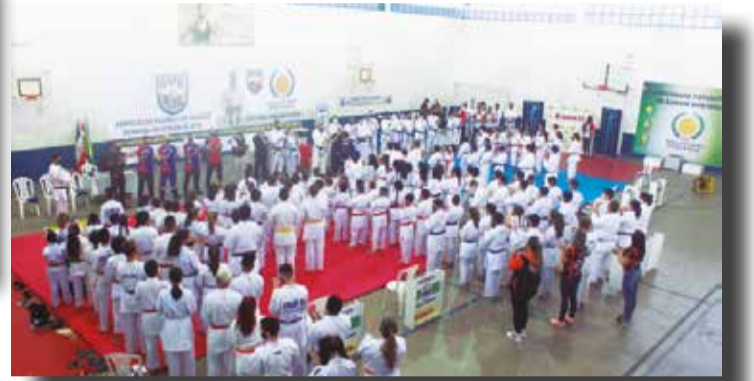
>> Num panorama geral podemos ver o dispositivo montado, a participação de 11 delegações somando 169 atletas.