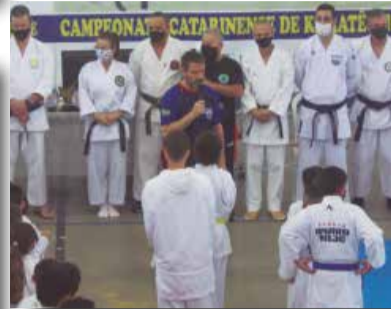
>> Momento em que o presidente da APK, fazia a abertura do evento.