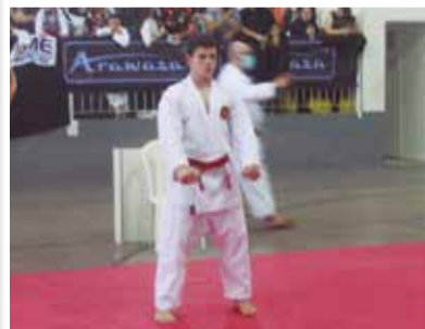
>> Os atletas se apresentaram com grande foco e determinação.