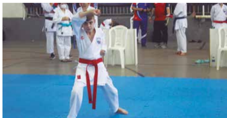
>> A participação de vários municípios, consolida o trabalho que a Associação Palhoça de Karatê vem realizando no cenário esportivo dentro do Karatê do Estado.