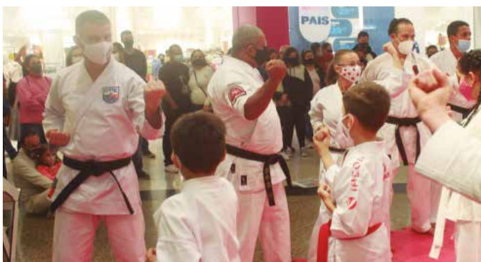
>> Cada momento que passamos juntos dividindo experiências vividas no Karatê são histórias lindas para contar.