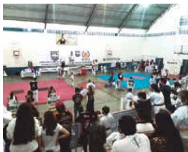
>> Competição bateu o record de público do Ginásio Nazareno Cândido.