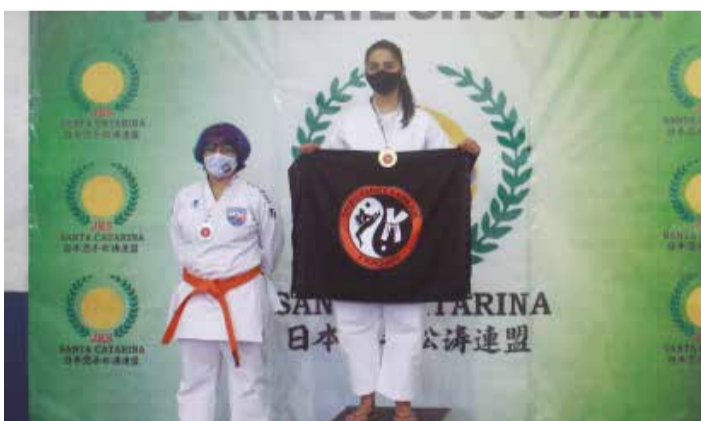
>> Indaial em primeiro e Palhoça em segundo. Master B.