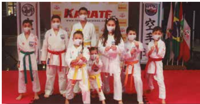
>> Uma das coisas que aprendemos aqui na APK é que todos nós somos iguais e irmãos no Karatê.