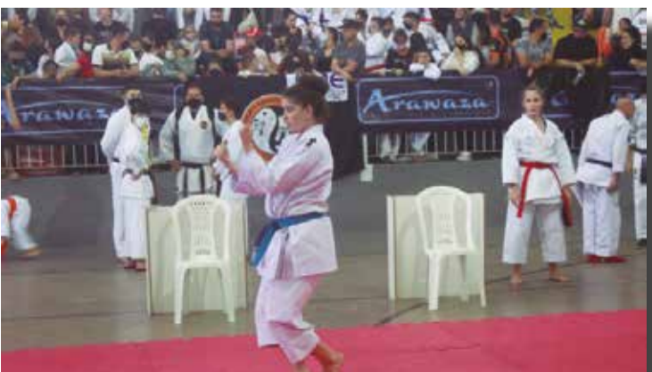
>> Lotado, o Ginásio Nazareno Cândido presenciou o maior evento de sua história.