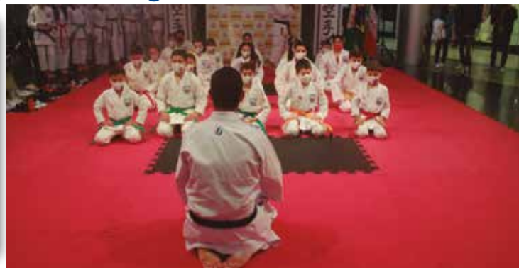
>> A posição de Seiza é uma postura de respeito e meditação.