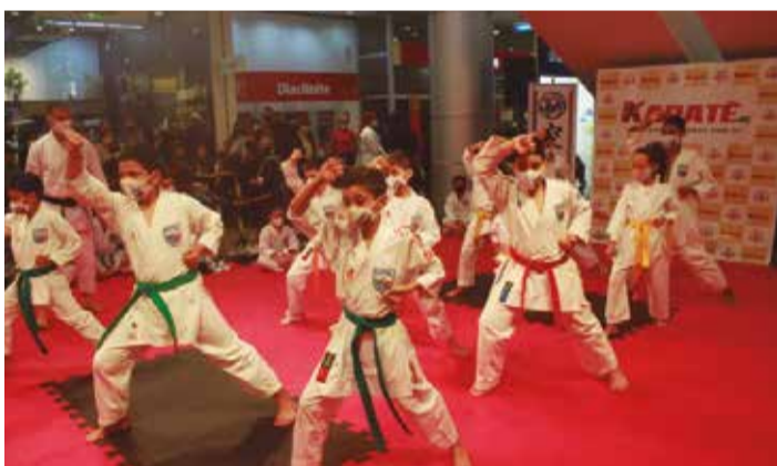
>> Foram muitas as apresentações.