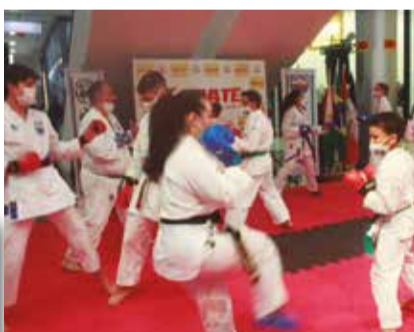
>> Todos aproveitaram para aprender muito durante o Karatê no Shopping, momento de treinamento especial com professores renomados.