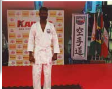
>> Estafort, do Haiti direto para o Brasil.