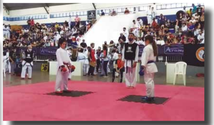
>> As arquibancadas ficaram lotadas para acompanhar as competições de Kumitê.