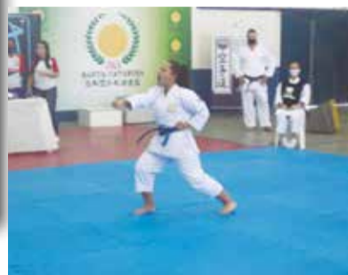
>> Quando tudo começou, vimos grandes apresentações.