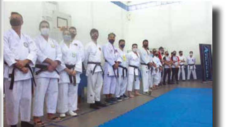
>> Professores postados na abertura da competição.