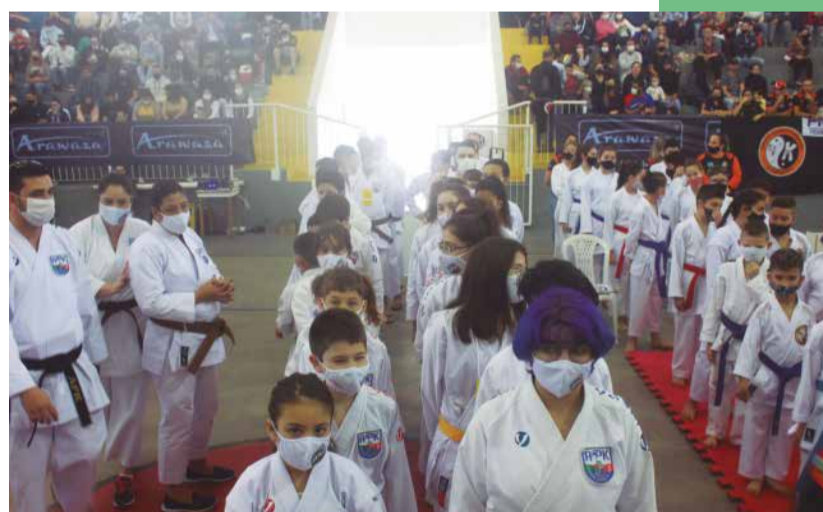
As arquibancadas ficaram lotadas por todo o dia. A presença marcante dos pais, mães e simpatizantes do Karatê fizeram de Palhoça o palco central do Karatê de Santa Catarina.