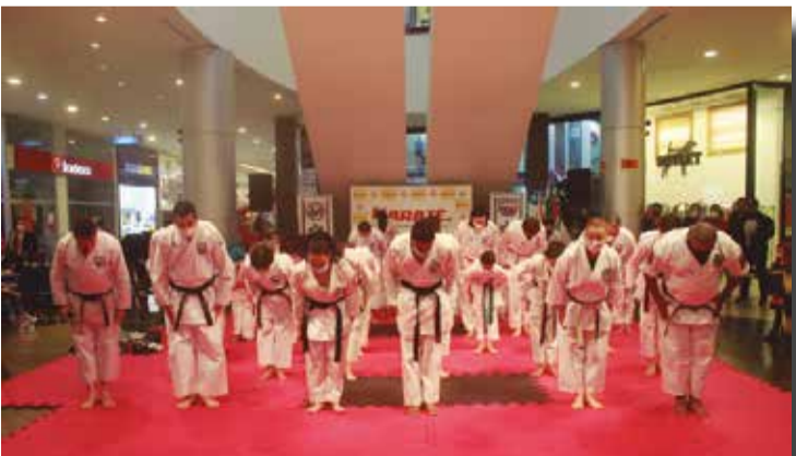
>> O Karatê nos une.