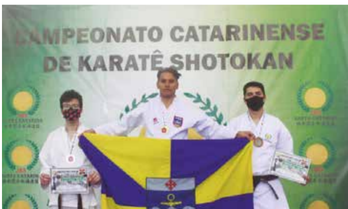
>> Atletas recebem as suas premiações.