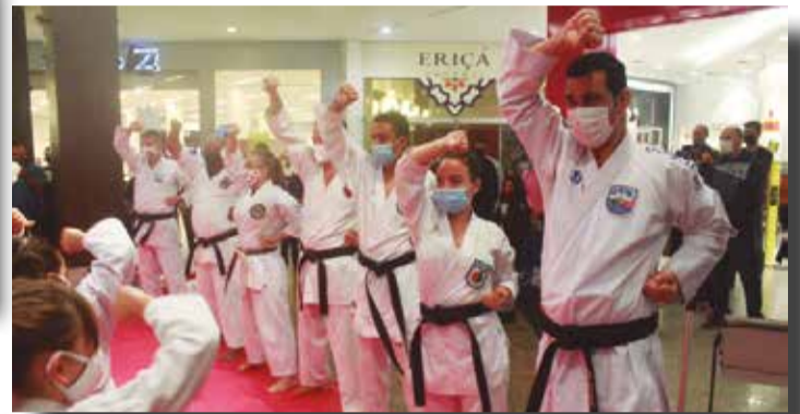
>> O dia foi repleto de grandes momentos e todos puderam ver a força do Karatê quanto instituição capaz de unir crianças, jovens e adultos.