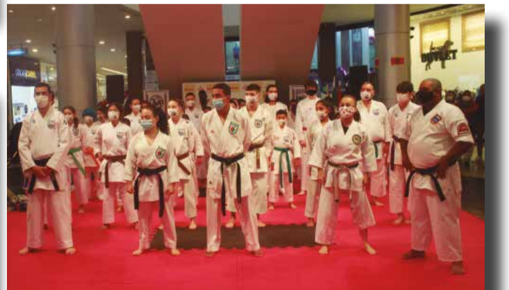
>> O Karatê é um esporte, uma arte marcial incrível.