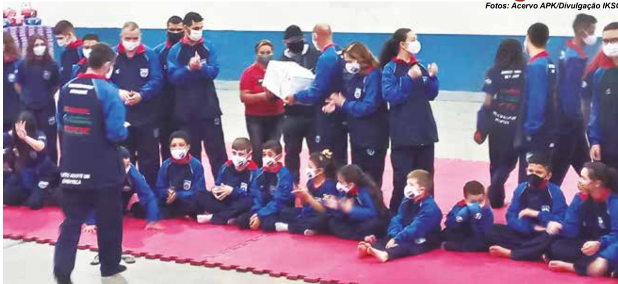
>> Com os novos agasalhos, alunos da Associação Palhoça de Karatê acompanham a entrega do prêmio.