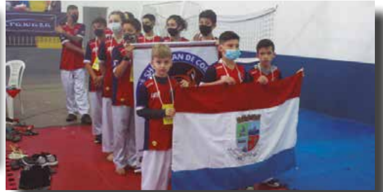
>> A cidade de Penha participando da abertura da competição.