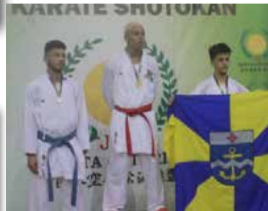
>> Navegantes no lugar mais alto do pódio.