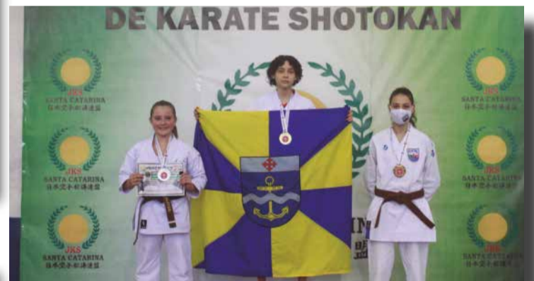
>> Navegantes em primeiro, Blumenau em segundo e Palhoça em Terceiro lugar na etapa de Palhoça.