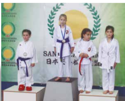
>> Atletas mirins fizeram apresentações belíssimas, coroados a etapa com grandes momentos.