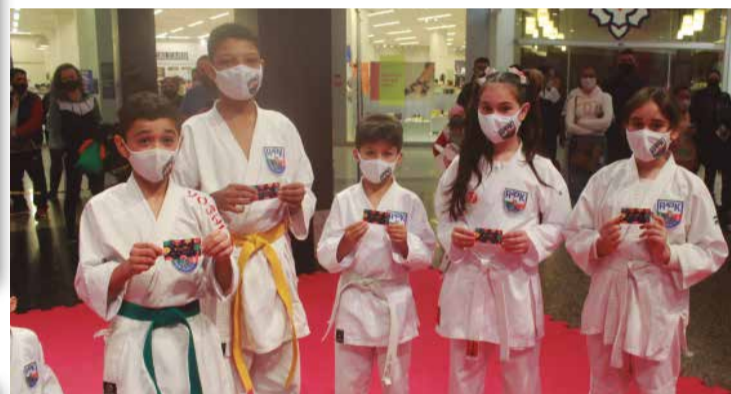
>> Eles ganharam no sorteio do Via Play ingressos para curtir o parque que fica dentro do Shopping ViaCatarina.